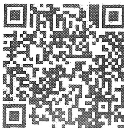
( 微博二维码 )